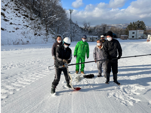
〈 救助訓練 〉