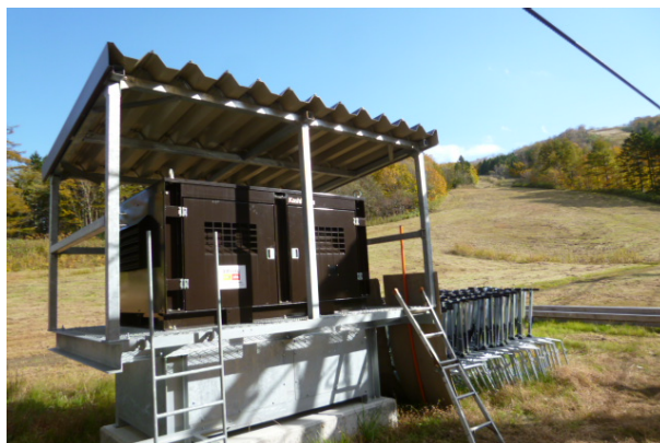
〈 リフト予備原動装置 〉

令和3年度には、停電等でリフトが停止した際に稼働し、短時間で乗客の救助が可能となるリフト予備原動装置の設置を行いました。