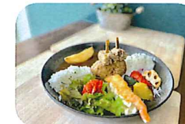
名物・ピリカダムカレー