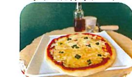
バジルとモッツァレラのマルゲリータ