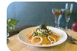
シェフおすすめ! スルメイカと半熟卵の タラコカルボナーラ

ピリカ併設のレストラン。ランチタイムでお気軽にご利用いただけます。シェフおすすめの「スルメイカと半熟卵のタラコカルボナーラ」や「ピリカダムカレー」など、ここでしか味わえない「欧風創作料理」が人気のレストランです!! [ランチタイム] 11:00~14:00(LO13:30) ※毎週火曜日が定休日です [ディナータイム] 17:00~19:45 ※宿泊のお客様のみ対応 ※LO19:15 [ブレイクファーストタイム] 6:30~9:00 ※宿泊のお客様のみ対応