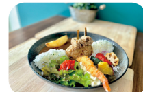
名物・ピリカダムカレー