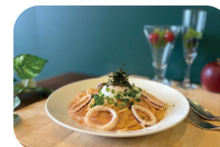
シェフおすすめ! スルメイカと半熟卵の タラコカルボナーラ