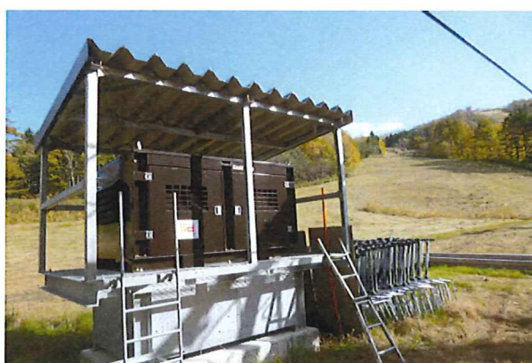
〈 リフト予備原動装置 〉

令和3年度には、停電等でリフトが停止した際に稼働し、短時間で乗客の救助が可能となるリフト予備原動装置の設置を行いました。