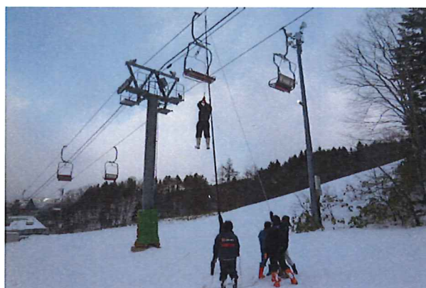
〈 救助訓練 〉