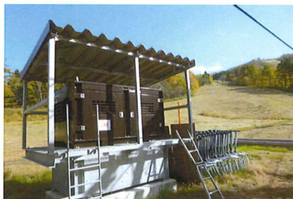
〈 リフト予備原動装置 〉

令和3年度には、停電等でリフトが停止した際に稼働し、短時間で乗客の救助が可能となるリフト予備原動装置の設置を行いました。