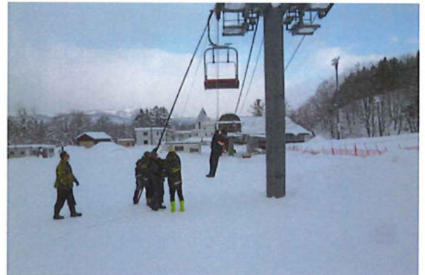
〈 救助訓練 〉