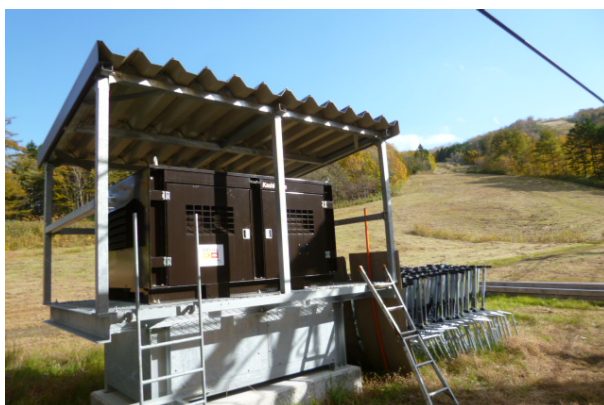
〈 リフト予備原動装置 〉

令和3年度には、停電等でリフトが停止した際に稼働し、短時間で乗客の救助が可能となるリフト予備原動装置の設置とセーフティバーの更新修繕を行いました。