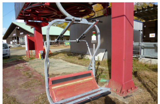
〈 セーフティバー更新 〉