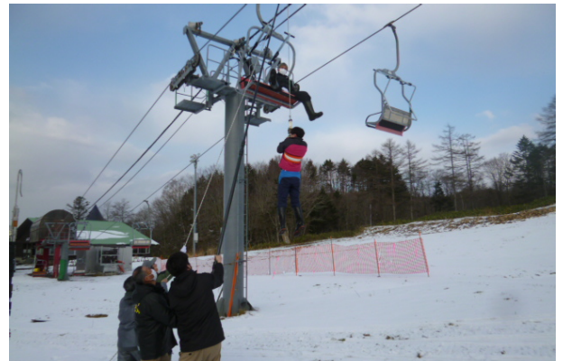
〈 救助訓練 〉