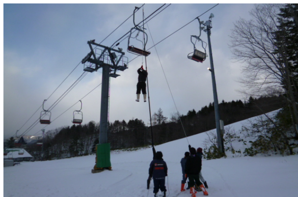
〈 救助訓練 〉