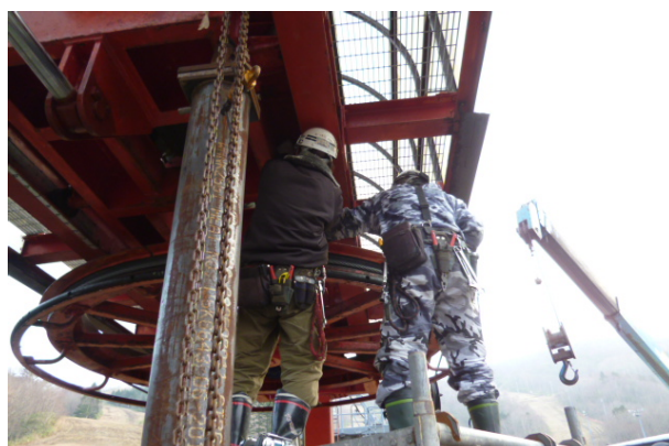
〈 山麓・大滑車コロ交換作業 〉